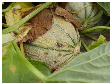
Fruit touché par la bactériose