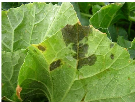
Feuille touchée par la bactériose

Lors des récoltes et après conservation des fruits, des dégâts, importants en fréquence et faibles en intensité, ont été notés.