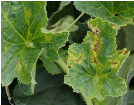
Feuilles touchées par la cladosporiose

Suite à la 2 ème contamination, lors des récoltes, des dégâts, importants en fréquence, mais de faibles intensités, ont été observés.