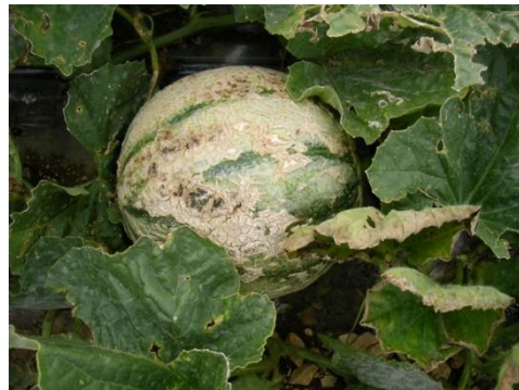
Fruit touché par la cladosporiose